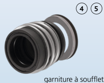
garniture à soufflet