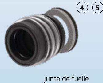
junta de fuelle